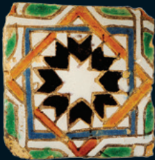
Dinheiros 1279-1325 | Bolhão

4 Azulejo | Séc. XVI. Azulejo com decoração geométrica polícroma realizado com recurso à técnica de corda seca, tipicamente mudéjar, muito em voga nos inícios do séc. XVI. Supõe-se que tenha integrado uma das divisões do antigo Paço Real da Ribeira, que se estendia até à Muralha de D. Dinis.